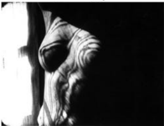
Le retour à la raison (1923)

« Entr'acte ne se décrit pas. Il faut le voir. Réalisé d'après un scénario de Francis Picabia pour être présenté aux Ballets Suédois avec le ballet Relâche, musique de Satie, c'est le premier film réalisé en dehors de l'industrie cinématographique avec pourtant des moyens financiers suffisants. L'humour et la poésie s'y mêlent dans un rythme frénétique avec la même cocasserie que dans les comédies de Mack Sennet dont Clair s'inspire visiblement mais avec plus de liberté encore à l'égard de la logique », Jacques-B. Brunius in En marge du cinéma français , éd. L'Âge d'Homme, Lausanne, 1987, p. 63.